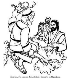
Zachäus, who was very short, climbed a tree so he could see Jesus.