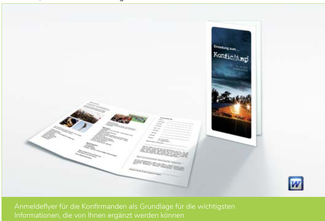
Anmeldeflyer für die Konfirmanden als Grundlage für die wichtigsten Informationen, die von Ihnen ergänzt werden können

Neben den Vorlagen für die Anmeldeflyer, Schulbefreiungen und der Anmeldeliste, stellen wir Ihnen desweiteren noch die Informationen für Ihre Mitarbeiter und die Anreiseinformationen zusammen, die wir Ihnen rechtzeitig zukommen lassen.